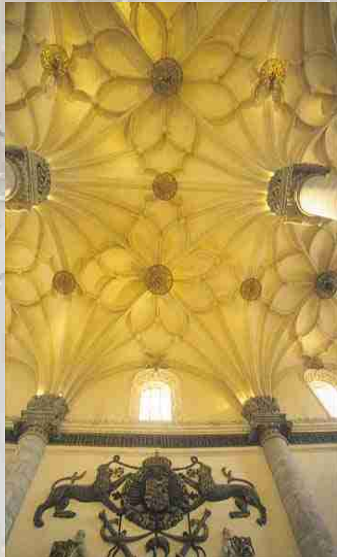
Interior de la Lonja (Abilio Lope)